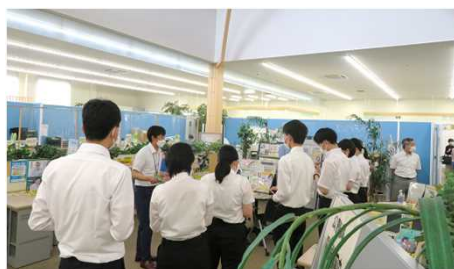
ハローワークプラザ宮崎内で説明している様子

国家公務員一般職試験（大卒程度）の受験生を対象に、ハローワークプラザ宮崎（6月23日）、宮崎労働基準監督署（6月26日）で業務説明会を開催しました。