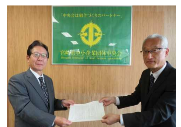
野口中小企業団体中央会専務(左)