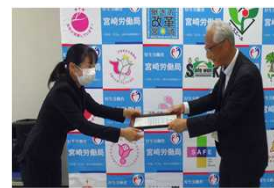
高山建設高山氏（左）

株式会社高山建設（高原町）は、資格取得に係る費用の全額支給など、従業員のキャリアアップに取り組まれ、月平均の所定外労働時間が10時間を下回るなど、ワークライフバランスの充実を図っている企業です。