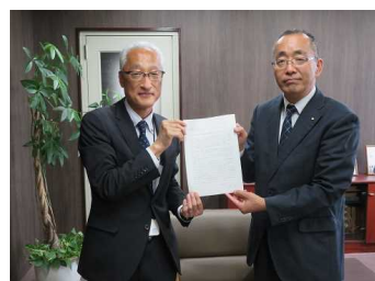
酒匂商工会連合会専務（右）