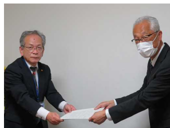
中原商工会議所連合会専務（左）