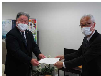
河野経営者協会専務（左）