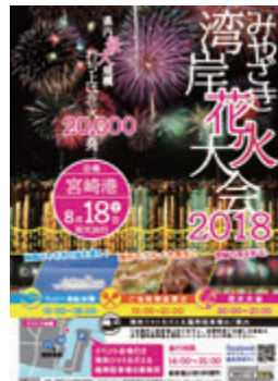
デザイン（Web・印刷物）