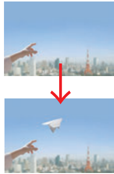
写真の修正や合成