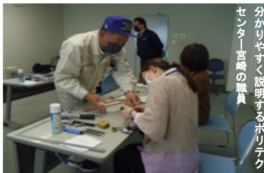
センター宮崎の職員 分かりやすく説明するポリテク

ス配管作業を体験しました。 参加者からは「内容がわかりやすかった」「ポリテクセンター見学会に参加し訓練受講を検討したい」等の感想を頂きました。今後も様々な内容の体験会を定期的に関催し、受講生確保につなげていきます。