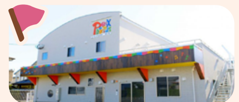
フェニックスキッズ (おおはし・つるのしま・宮交シティ・宮崎駅東口・宮崎ナナイロ)