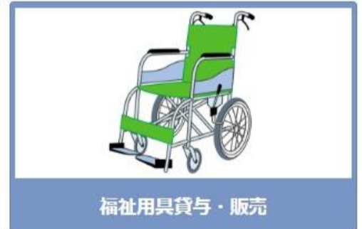
福祉用具貸与・販売