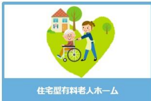
住宅型有料老人ホーム