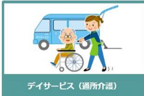
デイサービス（通所介護）