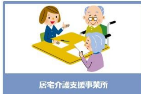
居宅介護支援事業所