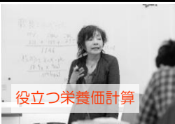
役立つ栄養価計算