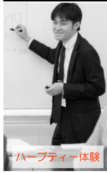
ハーブティー体験

授業の開始前に朝礼、終了後に終礼を行います。 訓練の一環として、日直および掃除当番等があります。 訓練中に実施するキャリアコンサルティングは放課後30分程度行います。(訓練期間中1人3回) 修了後に取得できる資格(任意受験)については、各自が受験した試験に合格することにより取得できます。