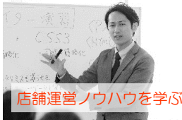
店舗運営ノウハウを学ぶ