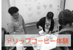
ドリップコーヒー体験