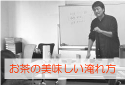
お茶の美味しい淹れ方