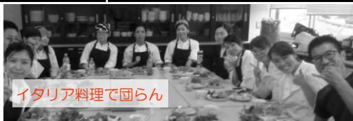
イタリア料理で団らん