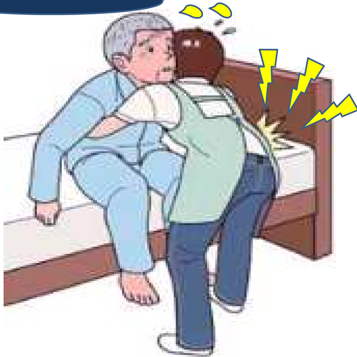
社会福祉施設 死傷災害(休業4日以上) 【事故の型別】【H22~27年】