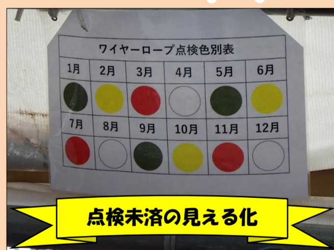
点検未済の見える化