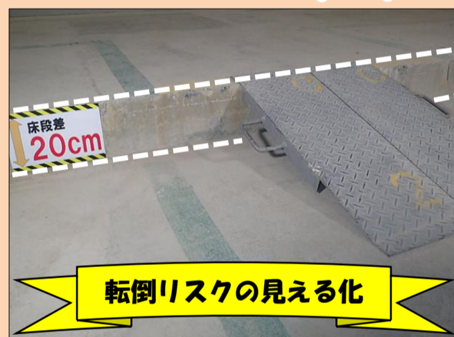
転倒リスクの見える化