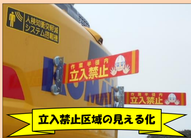
立入禁止区域の見える化