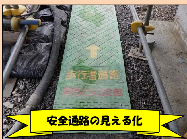
安全通路の見える化