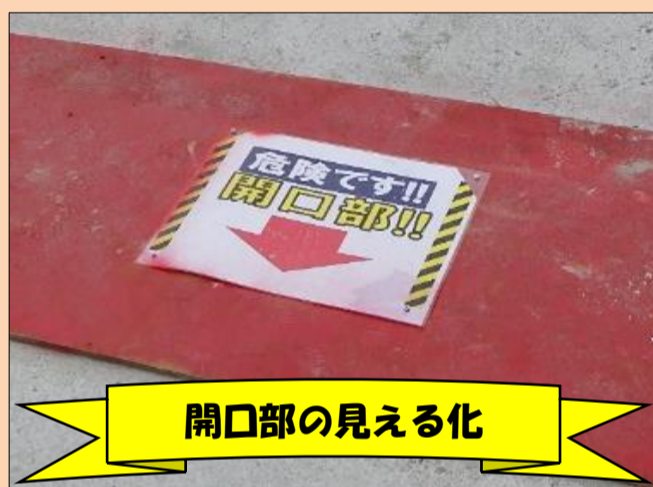
開口部の見える化