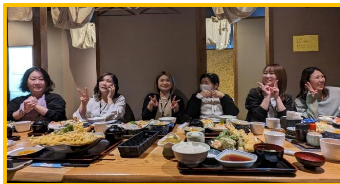
↑毎月のランチミーティング