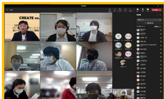
←リモート形式の朝礼