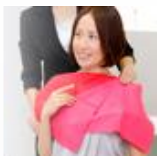
〈パーソナルカラー〉