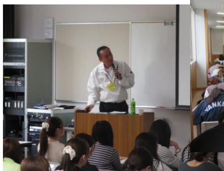
説明する宮崎監理官