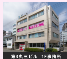
第3丸三ビル 1F事務所