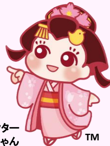
イメージキャラクター 桜姫ちゃん TM