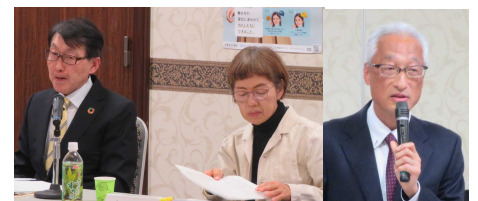
左から、有馬会長、伊達会長代理、坂根局長

宮崎労働局では、各委員の意見を踏まえ、令和5年度下半期の施策を進めてまいります。