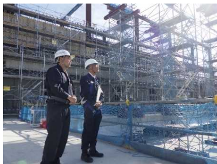
墜落防止措置の状況を確認する坂根局長（右）

坂根局長は、高所作業場からの墜落・転落災害、重機との接触災害等の措置状況を確認し、「県内の建設業における死亡災害は毎年発生しており、昨年、一昨年はそれぞれ4名もの尊い命が失われているなど、憂慮すべき事態となっている。本現場では、元請事業者による十分な連絡調整・連携を通じて無事故・無災害で工事を進めていただくことをお願する。」と現場作業員の方々に呼び掛けました。