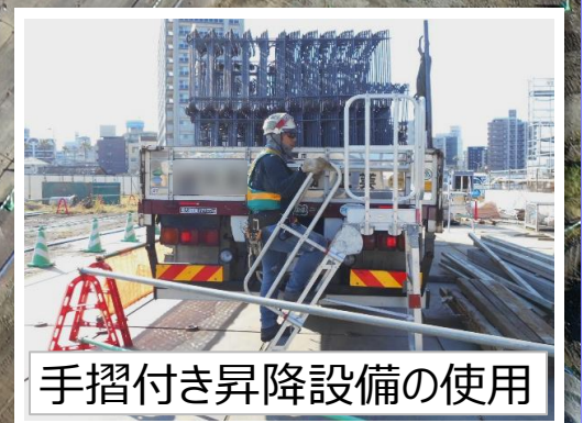
手摺付き昇降設備の使用