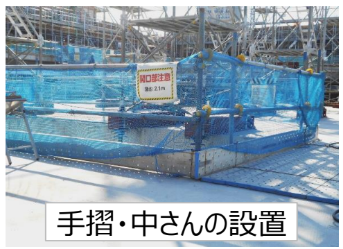
手摺・中さんの設置