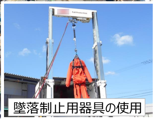
墜落制止用器具の使用