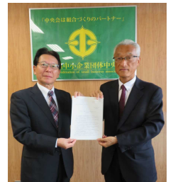
野口中小企業団体中央会専務（左）