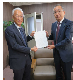
酒匂商工会連合会専務（右）