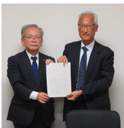
中原商工会議所連合会専務（左）