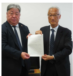
河野経営者協会専務（左）