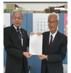
川越社会保険労務士会会長（左）