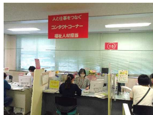
ハローワーク宮崎 コンタクトコーナーの窓口

今回は、11関係団体12名の方が出席され、各関係団体の担当者より人材確保対策に向けての取組や抱えている問題等について発言していただきました。