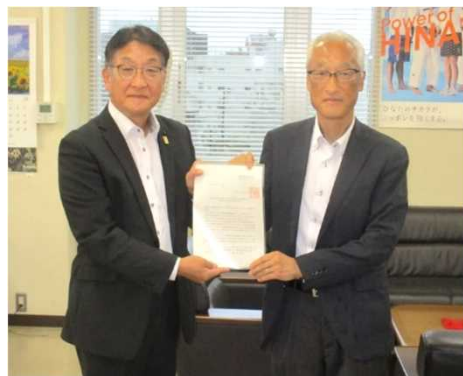
丸山商工観光労働部長（左）と坂根労働局長（右）