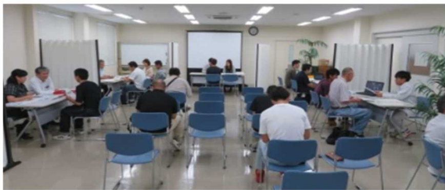
就職面接会会場の様子

人材確保対策推進事業の一環として、ハローワーク宮崎では、平成30年度より福祉分野（看護・介護・保育）・建設分野・運輸・警備の職種を対象職種に設定し、対象職種で働きたい方、対象職種の採用をお考えの事業主の方それぞれに、様々な支援メニューを設け支援していく総合的な支援コーナー（コンタクトコーナー）を設置しております。