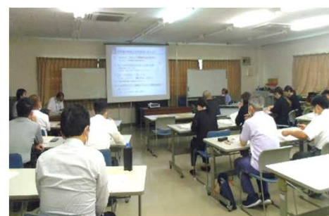
ハローワーク宮崎での講座の様子