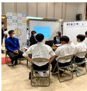
↑ 会場の様子 ↓