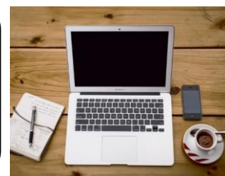
2019年11月修了(求職者支援訓練) 鉄道業界→IT企業就職

前職でIT業界とは全く関係のない鉄道会社に就職していましたが、広告関係の仕事をしたいと強く思いこの訓練を受講しました。最初はやっていけるのか不安でしたが、講師の方々のご指導がとても丁寧でゼロベースからでもしっかりとwebクリエイターの基礎が身に付けられます。また、資格取得できるのも多く、早期就職に向けた自分のスキルアップにとっても勉強になりました。授業の雰囲気も訓練生同士で仲良く出来るので明るいです。webにチャレンジしたい方は安心してください。