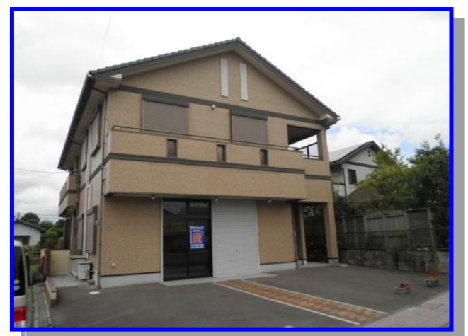
宮崎事業所・面接会場 ↑ ↓