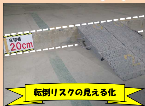
転倒リスクの見える化