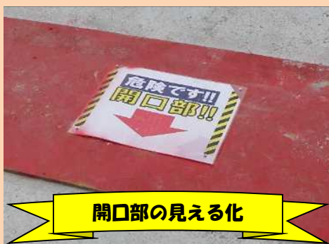
開口部の見える化