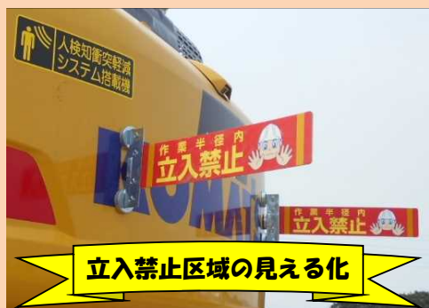
立入禁止区域の見える化