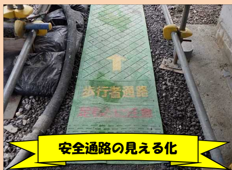
安全通路の見える化