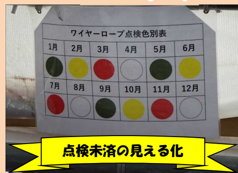
点検未済の見える化