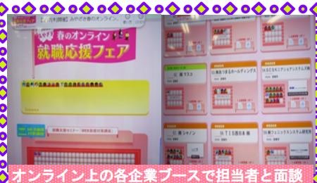
オンライン上の各企業ブースで担当者と同様