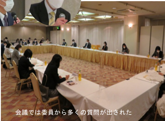
会議では委員から多くの質問が出された