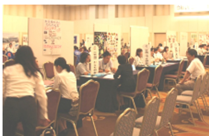
相談ブースが並ぶ会場

8月24日、ハローワーク宮崎は宮崎市において宮崎県福祉人材センター等との共催により福祉関係事業所と、就職を希望している求職者が個別に面談を行う「令和元年度福祉の仕事就職相談・面接会」を開催。会場にはハローワーク宮崎を始めとして8つの関係機関の相談コーナーが設置。69事業所、123名の求職者が参加しました。