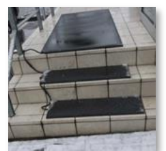
<ヒートマットの設置例>

駐車場内、駐車場から職場までの通路を確保するため、除雪や融雪剤の散布を行いましょう。また、出入口には転倒防止用のマットやヒートマットなどを敷き、夜間は照明設備を設けて明るさ（照度）を確保しましょう。