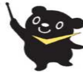
最低賃金制度のマスコット チェックマン

仙台労働基準監督署 Tel 022-299-9075 石巻労働基準監督署 Tel 0225-22-3365 古川労働基準監督署 Tel 0229-22-2112 大河原労働基準監督署 Tel 0224-53-2154 瀬峰労働基準監督署 Tel 0228-38-3131