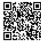
特定最低賃金 プレスリリース