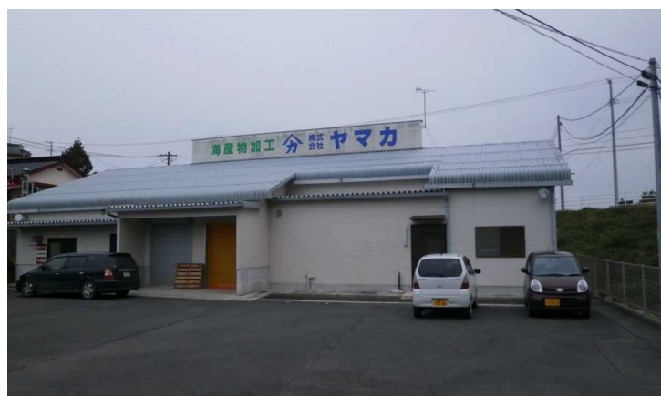
崎浜工場の外観です。こちらの工場ではわかめの食品加工が行われており、衛生管理を徹底している為、入室する為のチェックを厳しくしている工場です。