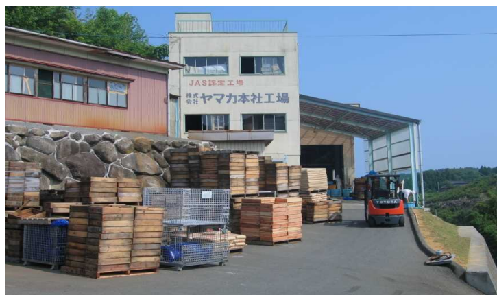
本社工場の外観です。こちらの工場ではわかめを袋に入れたり、選別をしたりする工場となります。