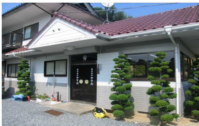
本社事務所の外観です。タイムカード等はこちらで打刻します。