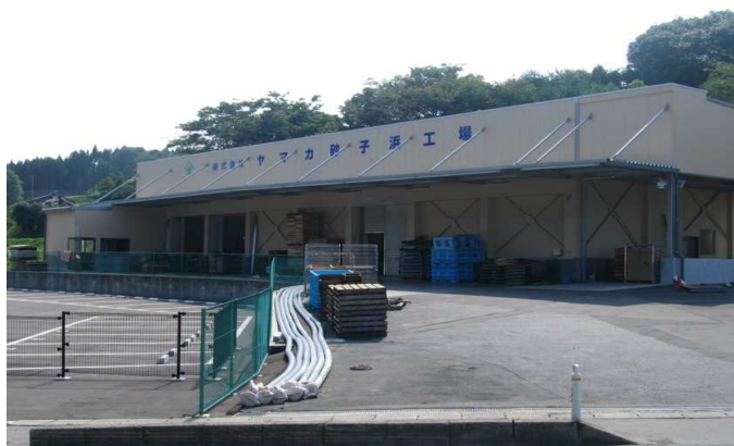
砂子工場の外観です。こちらの工場では生わかめの加工(ボイル等)を行っております。