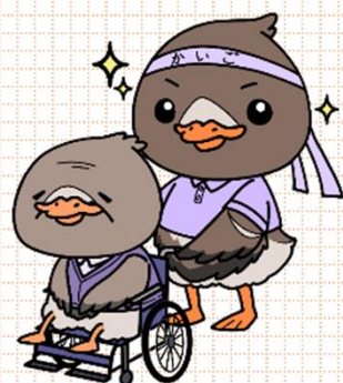
みやぎハローワークキャラクター ガンちゃんさん