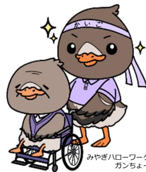
みやぎハローワークキャラクター ガンちょーさん