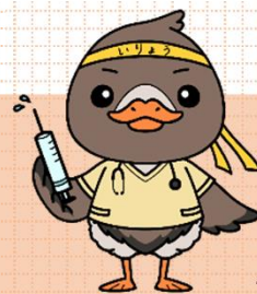
みやぎハローワークキャラクター ガンちゃんさん