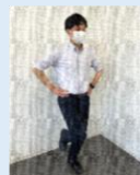
体力テストを 実施する