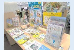
健康に関するパンフレット コーナーを設置する