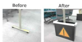
つまづきやすい 場所の見える化