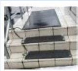
滑りやすい 箇所の対策