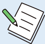
危険箇所の 洗い出し