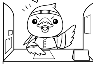
みやぎハローワークキャラクター 「ガンちょーさん」