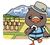
みやぎハローワークキャラクター ガンちょーさん

ご希望の方は、ハローワーク築館の受付にお申し出いただくか、電話にてご連絡ください。