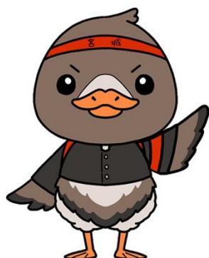
みやぎHW応援キャラクター ガンちょーさん