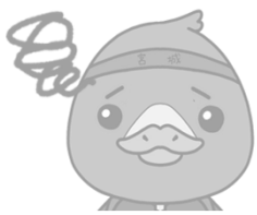
みやぎハローワークキャラクター ガンちょーさん