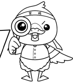
みやぎハローワークキャラクター 「ガンちょーさん」