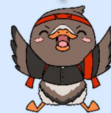
みやぎハローワークキャラクター ガンちょーさん