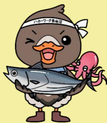
宮城ハローワークキャラクター 「ガンちょーさん」 気仙沼 Ver.