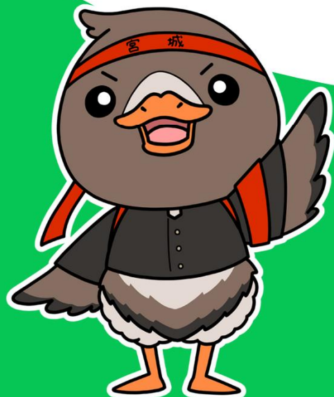
みやぎハローワーク応援キャラクター ガンちょーさん

ハローワーク主催 イベント のお知らせ、 求人情報 などの 最新情報 をお届けします！