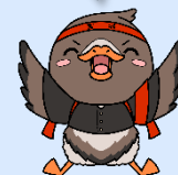
みやぎハローワークキャラクター ガンちょーさん