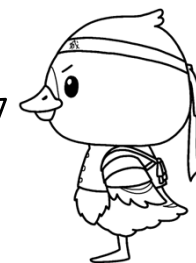
みやぎハローワークキャラクター 「ガンちょーさん」