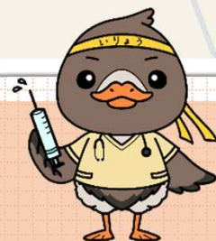
みやぎハローワークキャラクター ガンちゃんさん