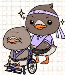
みやぎハローワークキャラクター ガンちゃんさん