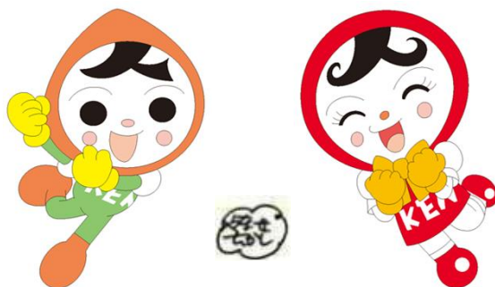
人権イメージキャラクター 人KENまもる君 人KENあゆみちゃん