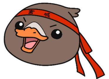
みやぎハローワークキャラクター「ガンちょーさん！」

「ガンちょーさん」は宮城県の県鳥、ガン(雁)をモチーフに、働く人と企業 を応援する応援団をイメージしたみやぎハローワークのキャラクターです。