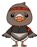
みやぎハローワークキャラクター▲ 「ガンちょーさん」