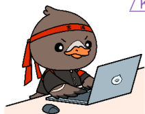
みやぎハローワークキャラクター▲ 「ガンちょーさん」

詳しくは☞ http://www.mhlw.go.jp/stf/seisakunitsuite/bunya/koyou_roudou/koyou_kyushokusha_shien/index.html