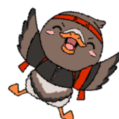
▶ みやぎハローワークキャラクター 「がんちょーさん」

詳しくは ☞ [県雇対(JC)] https://jobcafe.pref.miyagi.jp/