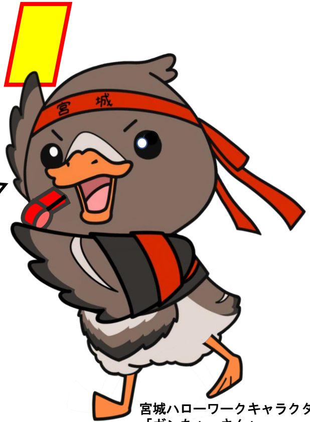
宮城ハローワークキャラクター 「ガンちょーさん」