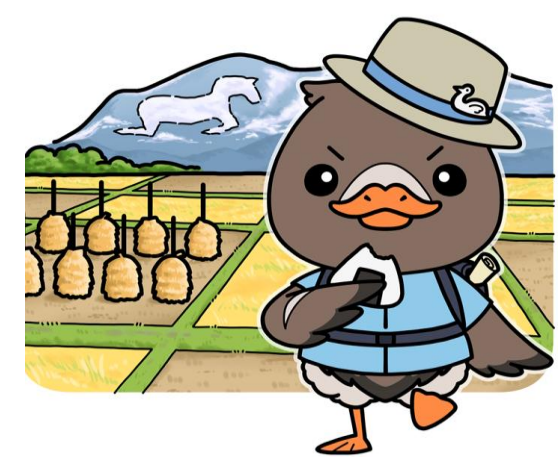
みやぎハローワークキャラクター ガンちょーさん