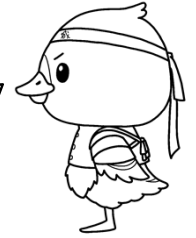
みやぎハローワークキャラクター 「カンちょーさん」