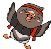
みやぎハローワークキャラクター 「がんちょーさん」

詳しくは☞ [県雇対 (JC)] https://jobcafe.pref.miyagi.jp/